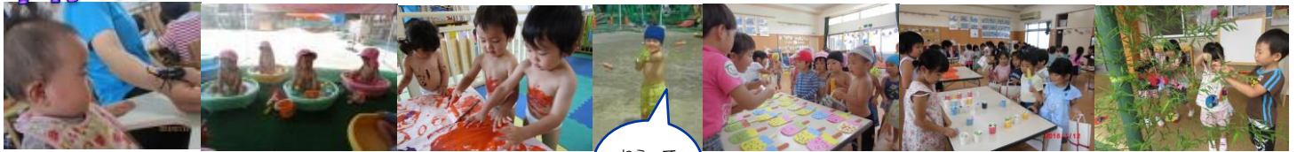
「カ、カ、カ、カブトムシ〜」初めて見る虫に目が点…♪