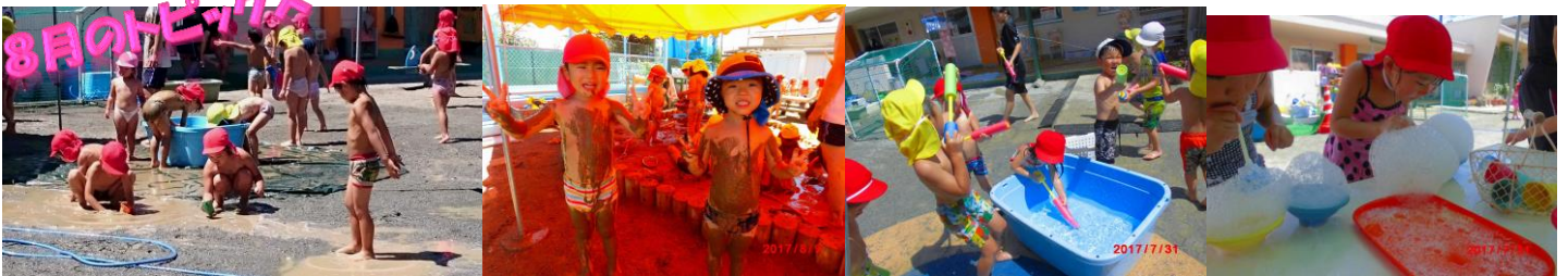
ウォーターパラダイス♪♪♪

「おはようございます」のあいさつは、相手を気遣い、寄り添うという気持ちであり、人として大切なマナーなのですね。その人の目を見て笑顔で「〇〇さん、〇〇くん、〇〇先生、おはようございます。」のあいさつが当たり前のように交わされることで、園全体が元気で明るい朝を迎えられることとなります。9月はその強化月間として位置付けていきたいと思います。保護者の皆様方も元気で明るいあいさつを是非よろしく願いいたします。